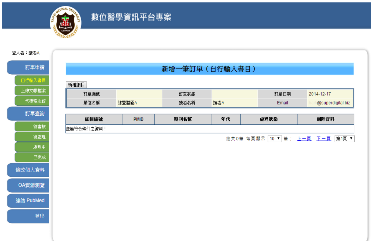
圖 2 登入首頁

讀者經系統確認帳號及密碼無誤後，系統進入『訂單申請(自行輸入書目)』，並有 1.『訂單申請』、 2.『訂單查詢』、 3.『修改個人資料』、 4.『OA 資料瀏覽』、 5.『連結 PubMed』等數個部分。