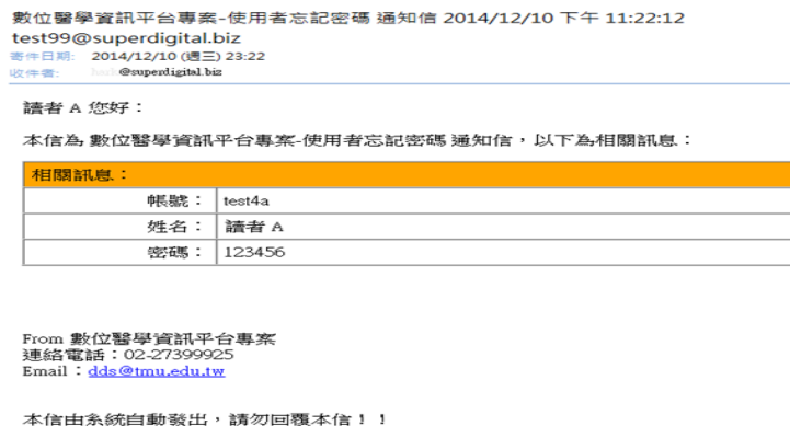
圖 4 忘記密碼

當讀者忘記密碼，必須先輸入帳號後再點選『忘記密碼』，系統會透過申請之 Email 自動發送密碼至讀者。